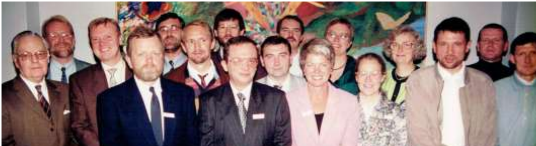
Årgang 1968 i 1993.