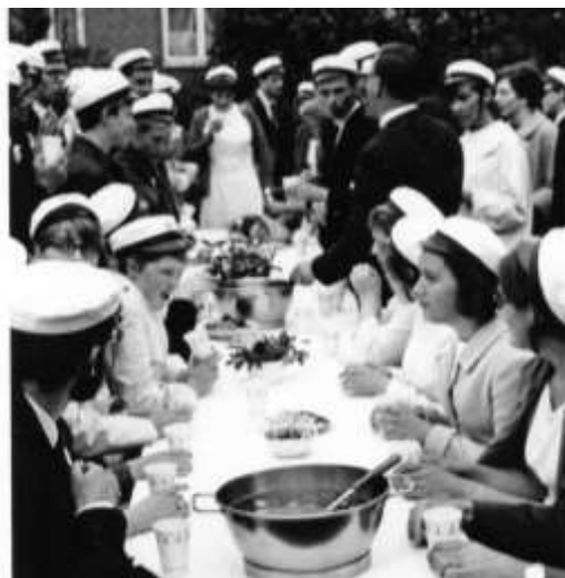
Glæde omkring punchebowlen